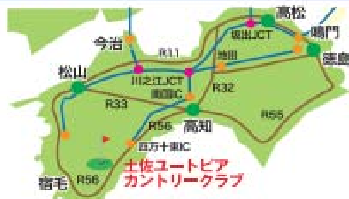
足摺岬 [高知方面より]高知自動車道經由 四万十町中央Cより国道56号線 車で約30分